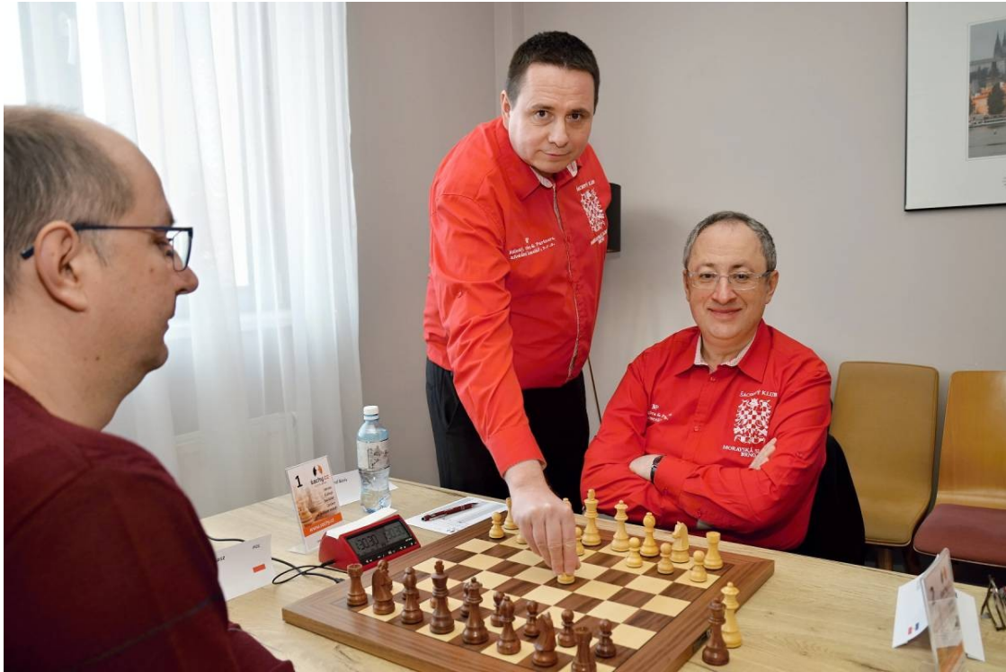
Legenda světového šachu Boris Gelfand v dresu Moravské Slavie Brno